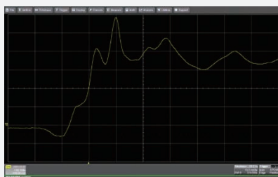
他社製差動プローブでの観測例