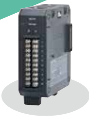
電圧/温度ユニット GL7-M