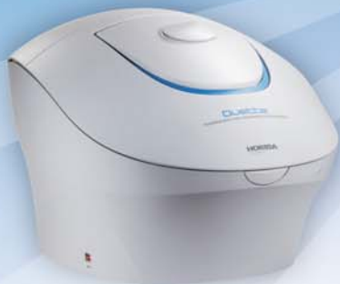
蛍光吸光分光装置 Duetta